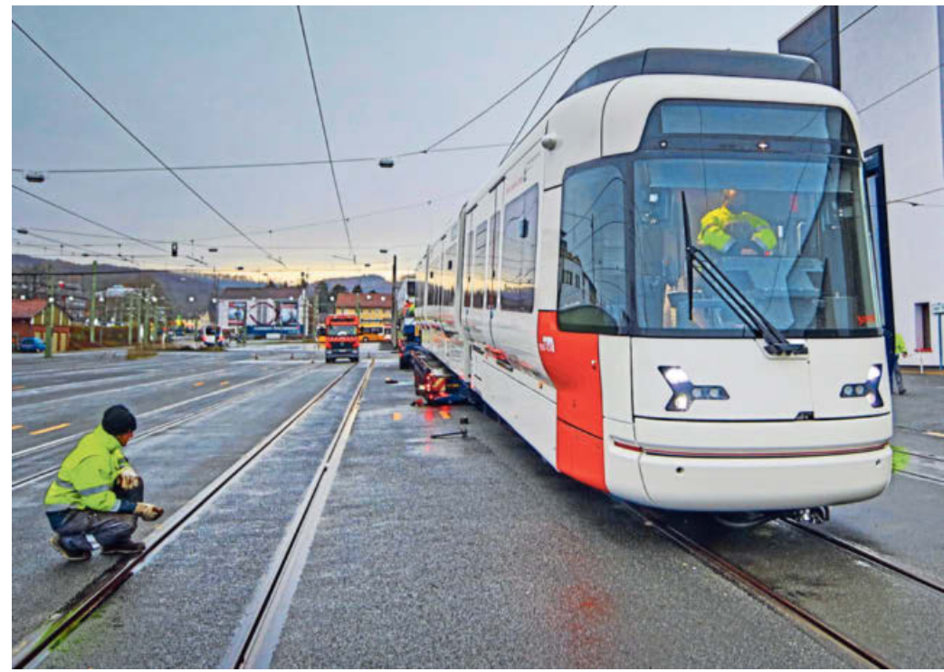
Der neue Vamos soll auf der neuen Linie 4 fahren. Er hat eine größere Kapazität mit 68 Sitz- und 162 Stehplätzen.

MoBiel, dass die Hochschulen noch besser angebunden werden. Ein neuer Haltepunkt wird am Campus Nord sein mit der neuen Fachhochschule. Die soll erweitert werden, andere Forschungseinrichtungen werden auf dem Campus angestrebt. Und am neuen Endpunkt Dürerstraße entsteht gerade die Neubebauung Grünwaldstraße mit Hunderten neuer Wohnungen, vor allem für Studenten. Perspektivisch könnten neue Wohngebiete in Richtung Babenhausen entstehen. Das ist aber höchst umstritten.