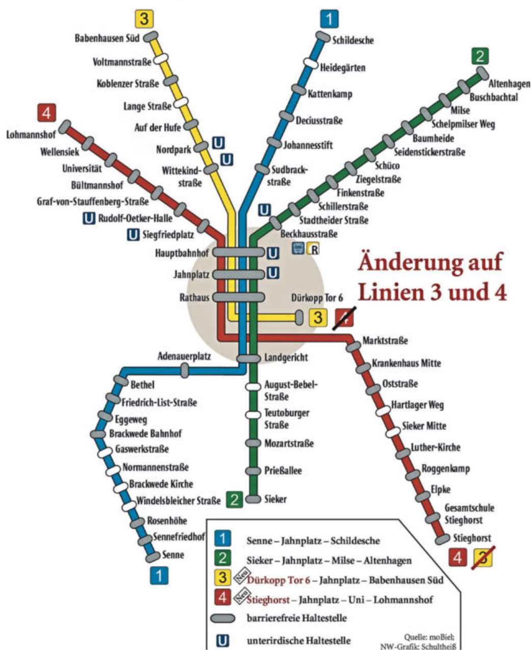
So sieht das Stadtbahnnetz ab 1. August 2021 aus. Dann ändert sich auch der Fahrplan. Der Zehn-Minuten-Takt bleibt.